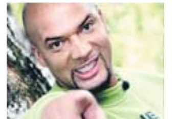
TV-Choreograph Detlef D! Soost tanzt in Krefeld.